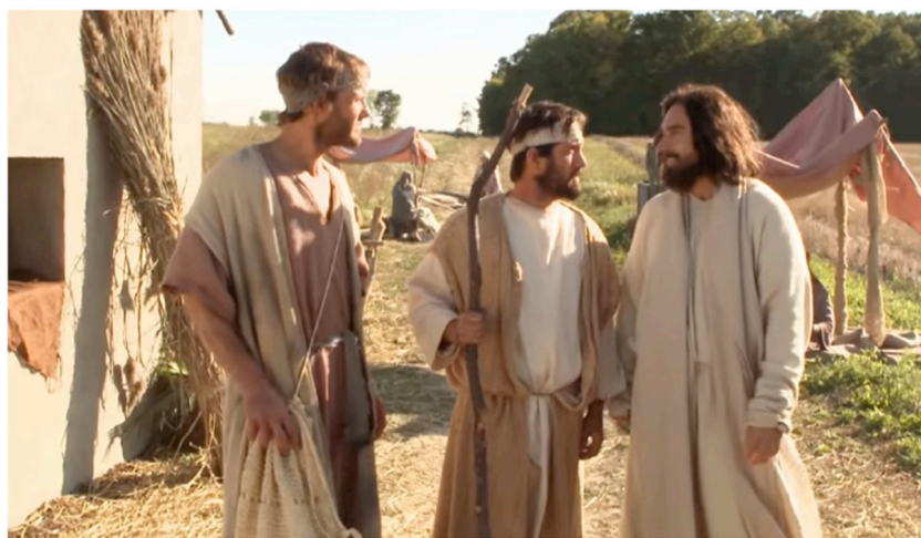
Imagen 3: Fotograma del film Camino a Emaús , de Bruce Marchiano (2010).

y al no hallar el cuerpo de Jesús, volvieron diciendo que se les habían aparecido unos ángeles, asegurándoles que él está vivo. Algunos de los nuestros fueron al sepulcro y encontraron todo como las mujeres habían dicho. Pero a él no lo vieron'. Jesús les dijo: '¡Hombres duros de entendimiento, cómo les cuesta creer todo lo que anunciaron los profetas! ¿No será necesario que el Mesías soportara esos sufrimientos para entrar en su gloria?'. Y comenzando por Moisés y continuando en todas las Escrituras lo que se refería a él. Cuando llegaron cerca del pueblo adonde iban, Jesús hizo ademán de seguir adelante. Pero ellos le insistieron: ' Quédate con nosotros, porque ya es tarde y el día se acaba '. El entró y se quedó con ellos. Y estando a la mesa, tomó el pan y pronunció la bendición; luego lo partió y se los dio. Entonces los ojos de los discípulos se abrieron y lo reconocieron, pero él había desaparecido de su vista. Y se decía ' ¿No ardía acaso nuestro corazón, mientras nos hablaba en el camino y nos explicaba las Escrituras?' '. En ese mismo momento, se pusieron en camino y regresaron a Jerusalén. Allí encontraron reunidos a los Once y a los demás que estaban con ellos, y estos les dijeron: ' Es verdad, ¡el Señor ha resucitado y se apareció a Simón! '. Ellos, por su parte, contaron lo que les había pasado en el camino y cómo lo habían reconocido al partir el pan" (24, 13-35).