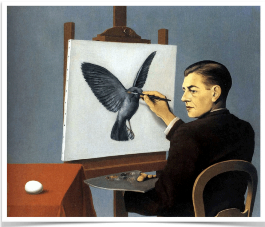
Imagen 1: René Magritte (René François Ghislain). La clarividencia (La Clairvoyance, 1936), óleo 21 1/4 × 25 9/16 pulgadas, 54 × 64.9 cm, Art Institute of Chicago. Autorretrato que proyecta la progresión de lo que es a lo que será.

“Enseñar con seriedad –afirma George Steiner en Lecciones de los maestros – es poner las manos en lo que tiene de más vital un ser humano. Es buscar acceso a la carne viva, a lo más íntimo de la integridad de un niño o de un adulto. Un maestro invade, irrumpe, puede arrasar con el fin de limpiar y reconstruir. [...] La mala enseñanza es, casi literalmente, asesina y, metafóricamente, un pecado” (p. 23).